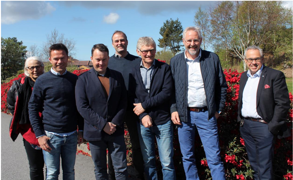
Opptastsmøte blei gjennomført tysdag 7. mai. Frå venstre:

Prosjektet organiserast med ei styringsgruppe. Styringsgruppa er satt saman av representantar frå prosjekteigarane; kommunane Sund, Fjell og Øygarden. Gode Sirklar, som er kommunane sitt felles utviklingsapparat, har det overordna prosjektansvaret.